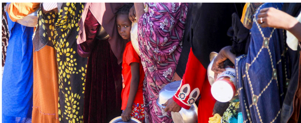
Une jeune fille soudanaise ayant fui Al Fasher fait la queue avec des femmes pour avoir à manger au camp Al Afad qui abrite des personnes déplacées de la ville d'Al Dabba, le 20 novembre 2025.

La persistance des conflits en Afrique a directement contribué à ce qu'un nombre record de 167 millions d'Africains soient confrontés à une insécurité alimentaire aiguë, avec 700 000 d'entre eux menacés de famine.