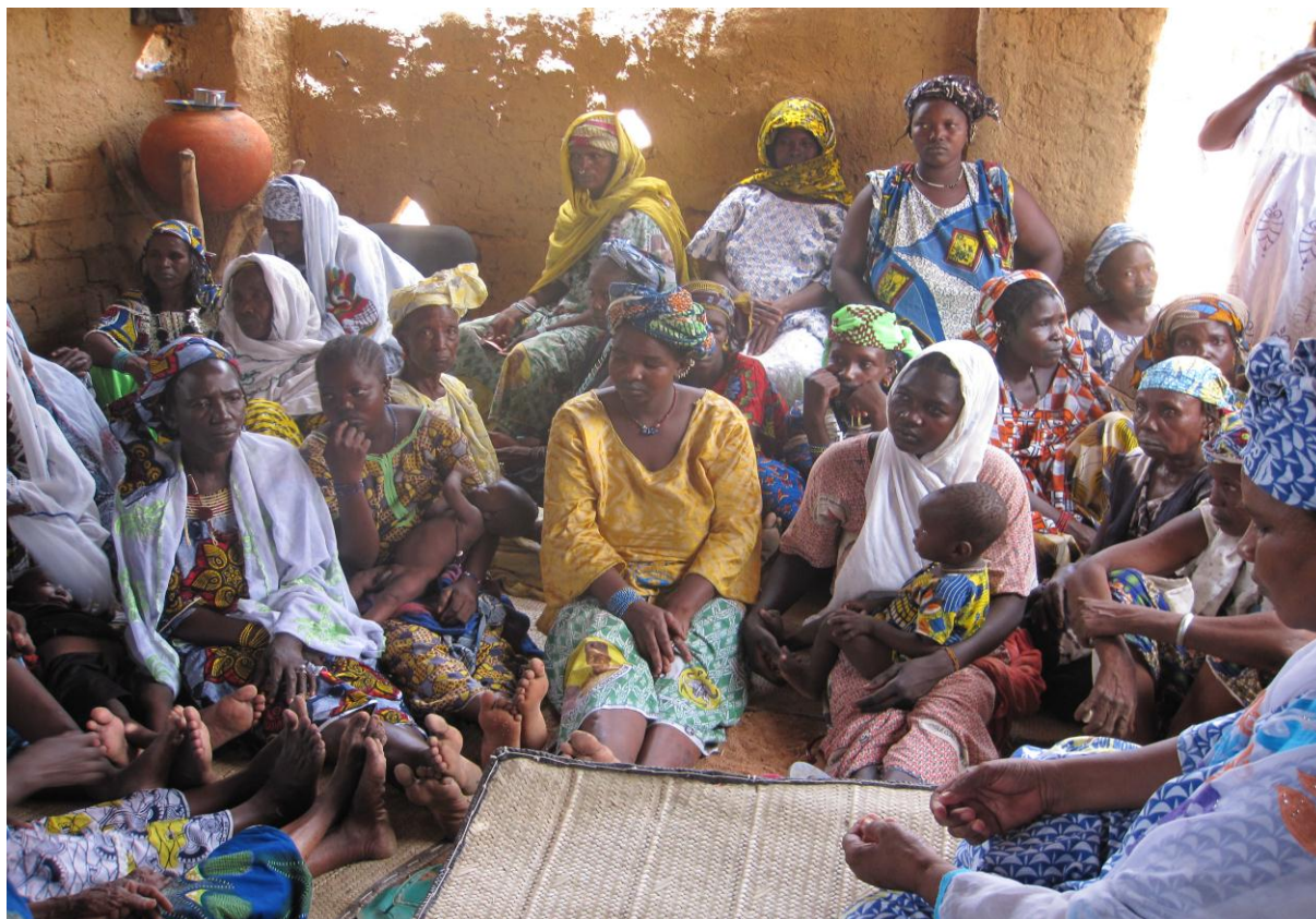
Photo 7 : Diagnostic communautaire avec les femmes de Gandamia/ Mopti (DEBACOM)

Le dialogue intercommunautaire dans les processus de réconciliation est une démarche de construction sociale, en ce sens qu'il vise, à partir de l'interaction qu'il crée, à apporter des réponses concrètes aux « facteurs moteurs » d'un conflit donné. Dans ce registre, les