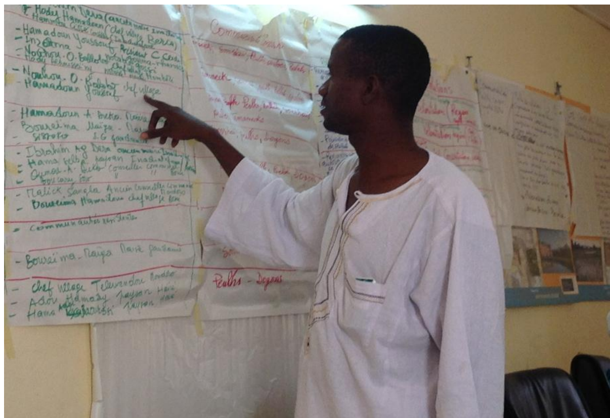
Photo 3 : Rencontre intercommunale à Douentza/ Mopti

L'analyse de la littérature scientifique rend compte d'une abondance de références sur la problématique des rencontres inter et intra communautaires. Cette littérature révèle de prime abord qu'une diversité d'approches et de mécanismes existent en matière de dialogue communautaire. A cet effet, on distingue les mécanismes étatiques (ou encore administratifs et juridiques), les mécanismes traditionnels et les mécanismes alternatifs. (Kornio et al. 2004). On notera également que le champ global d'application de tels mécanismes demeure le processus de dialogue et de réconciliation (Ba Boubacar, 2016). En effet, le processus de dialogue et de réconciliation fait référence aux